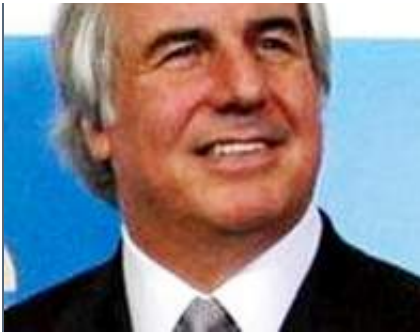
Frank William Abagnale jr.: amerikansk sjekksvindler og bedrager som sonet flere år i fengsel etter at han på 1960-tallet forfalsket sjekker verd 2,5 millioner dollar i 26 ulike land. Livet hans er filmatisert i filmen Catch Me If You Can.

person som noen har lyst til å gjøre vondt, er det mer etisk forsvarlig å lyve ved å si at du ikke vet hvor han er. Hos Ibsen finnes det personer som avviser det som en mulighet. Gregers Werle er en slik, han er besatt av sannheten og er ikke utelukkende sympatisk. Det er moralsk klanderverdig å lyve, men ikke alltid.